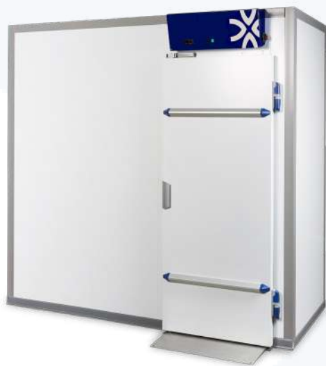
Chambres CFPL DF