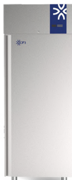
BLUE CARE 68 600 x 800 mm