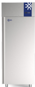
BLUE CARE 64 600 x 400 mm